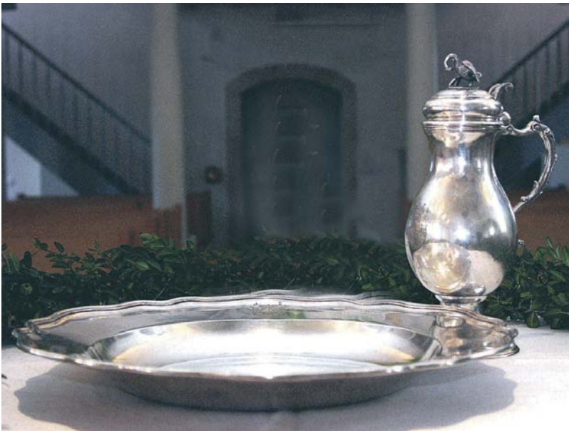
Silbernes »Taufkännlein« und silbernes Taufbecken von 1780