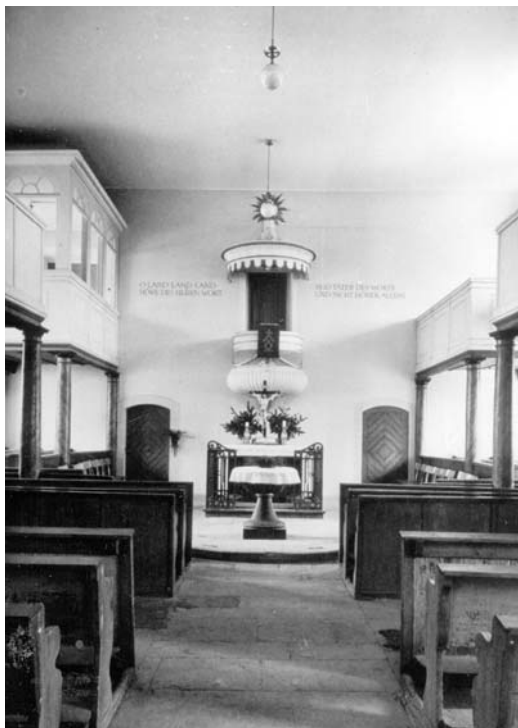
Innenraum der Birkacher Kirche vor der Renovierung 1963

1995 wurde die Kirche, vor allem auch der Dachstuhl gründlich instandgesetzt und renoviert. Die der Ev. Kirchengemeinde verbleibenden Kosten mit 100.000 DM waren ein gewaltiger »Brocken«; letztendlich waren noch 20.000 DM ungedeckt.