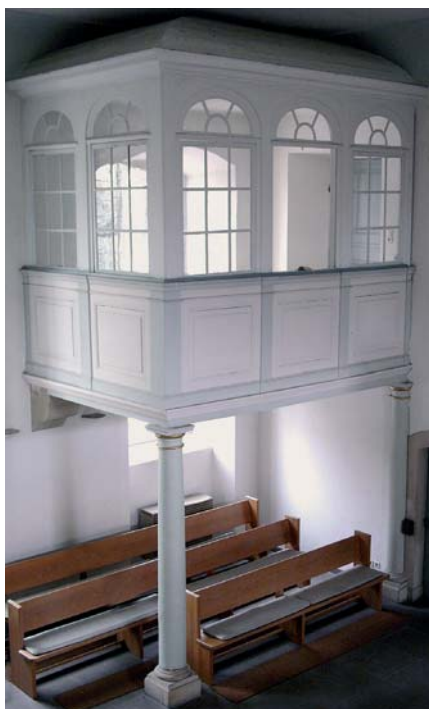
Der »Franziskastuhl« in der Birkacher Kirche

An der Kirchendecke, an der Orgelbrüstung und auf dem Kirchturm befinden sich die Initialen von Herzog Carl Eugen von Württemberg.