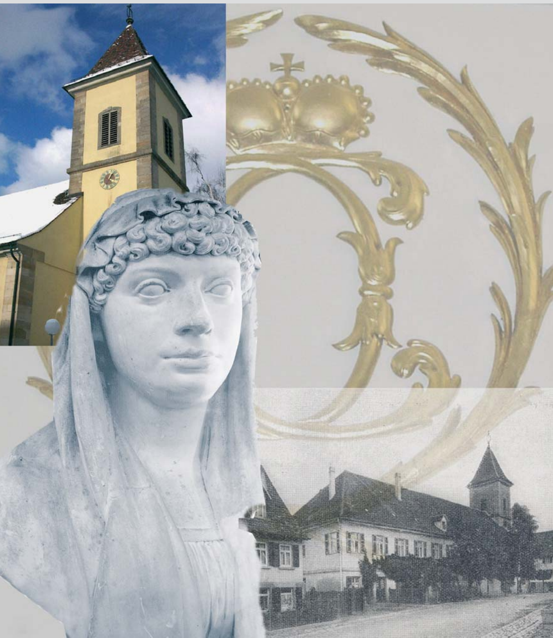
Gipsbüste Franziskas von Hohenheim in der Mauritiuskirche in Sindlingen