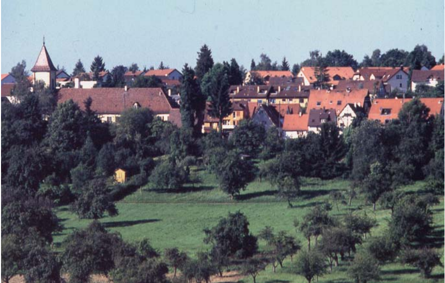
Birkach von Kemnat aus (Oberer Haldenweg)

Weiter ist dort zu lesen, die übrigen Filderorte seien »durch geschlossene, zum Teil sehr stattliche Bauernhäuser und große Gewannfluren« geprägt (z. B. Echterdingen, Bernhausen, Möhringen, Plieningen).