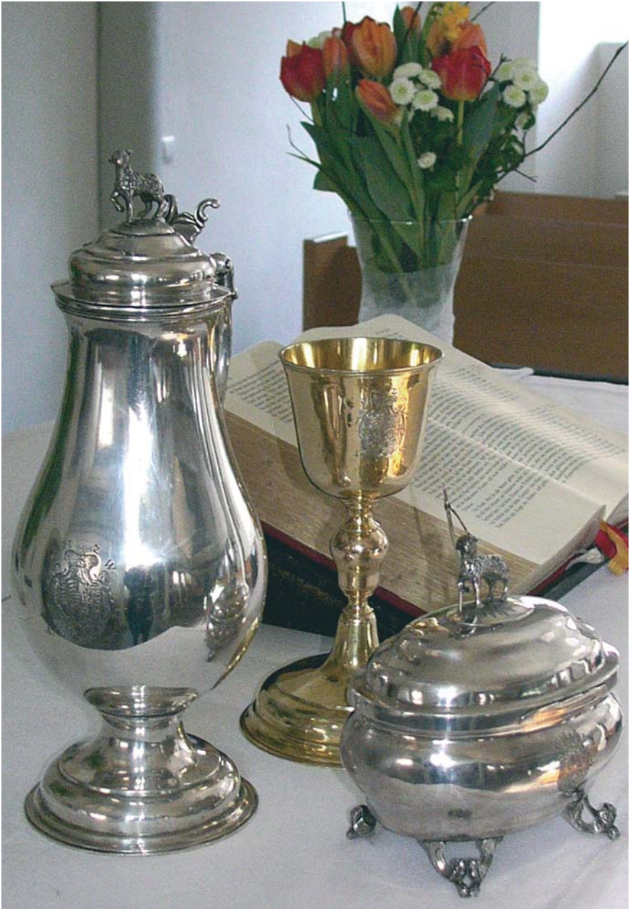
Abendmahlsgeräte »Communionsskanne«, Hostienkapsel und Kelch (1780)