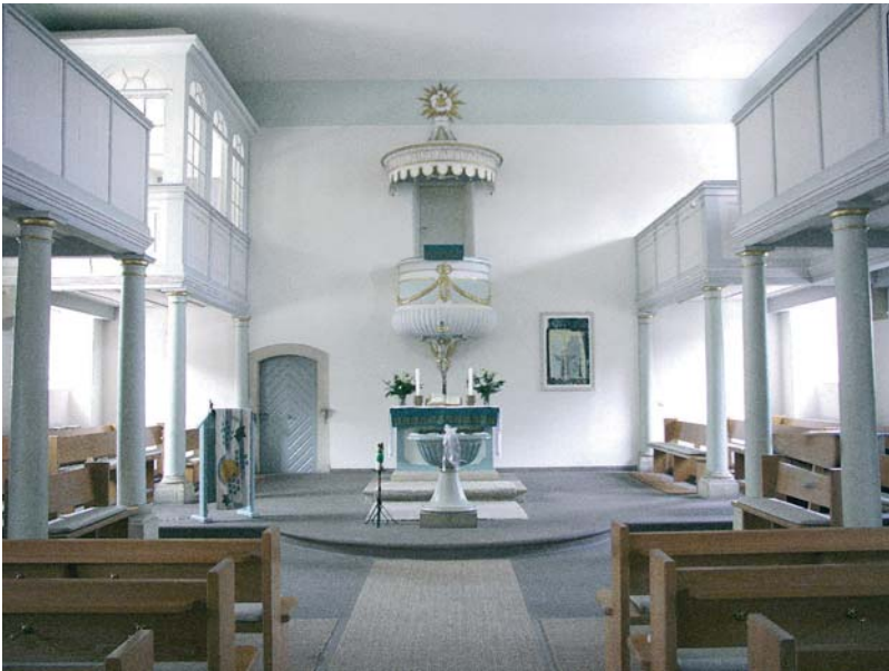
Innenraum der Franziskakirche